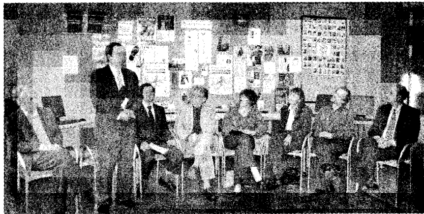
灣區多個結核防治組織於舊金山卡斯楚區召開世界肺結核日記者會，呼籲民眾提高對肺結核的警覺性。

過去數十年來，舊金山的肺結核案例比率一直是全美擁有地鐵的城市中最高的，以2008年來說，舊金山共發現118個肺結核案例，也就是每10萬人中就有14.6人為肺結核患者，這個比例為加州的兩倍、全美的四倍。